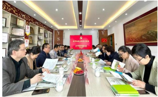
图1：互学共建主题党日活动

4月13日，兰州大学资源环境学院环境系教工党支部全体党员走出校门，来到一山一水参观考察，并与一山一水党支部联合开展“学党史·践初心——互学共建主题党日活动”，两个党支部的20余名党员参加了此次主题党日活动。