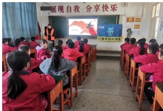
图 29：安全课程授课现场

壹基金儿童平安小课堂项目通过安全课程和主题活动，提高学生应对灾害风险的能力，以参与式、体验式方法教给学生关于危险的知识和技能，让学生在在学习知识、参与活动的过程中学会独立思考和灵活判断，培养学生对待灾害风险的探索热情和学习兴趣。