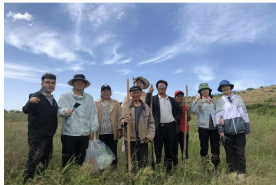
图 20：生态林实地取样

2021年2月至2022年2月，镇原县中原乡田站村生态林生态效益评估项目由施永青基金（香港）北京代表处资助实施，通过对“镇原县中原乡田站村生态林项目”生态林不同区域、不同阶段的生长变化进行数据监测，完成生态林生态效益评估，探索可复制可推广的生态效益评估模式，为建立应对气候变化和生态效益补偿的机制提供参考依据。