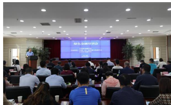
图 13：绿色金融培训会

为进一步贯彻落实国家绿色金融政策，引导金融行业关注环境保护，一山一水联合甘肃省金融学会、定西市金融学会于2021年6月25-30日在兰州市和定西市举办了绿色金融知识培训班。培训班邀请了甘肃农业农村厅、甘肃省金融学会绿色金融研究中心、兰州环境能源交易中心、兴业银行兰州分行相关专家开展了专题培训。兰州市、定西市两级监管部门、金融机构等90余人参加培训。由于疫情影响项目其他会议活动暂停举办。