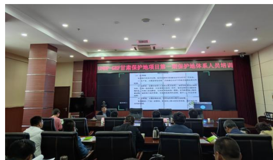
图 12：GEF 项目培训

一山一水承接了甘肃省森林防火预警监测信息中心（甘肃省林业外资项目管理办公室）委托 UNDP-GEF 甘肃保护地项目保护地体系人员能力建设项目。2021 年项目期间，一山一水共开展 3 期保护地体系人员能力培训班，GEF 甘肃保护地项目实施单位裕河自然保护区、插岗梁自然保护区、阿夏自然保护区和多儿自然保护区管理局工作人员及四个保护区共管社区代表共 479 人次参加了培训。