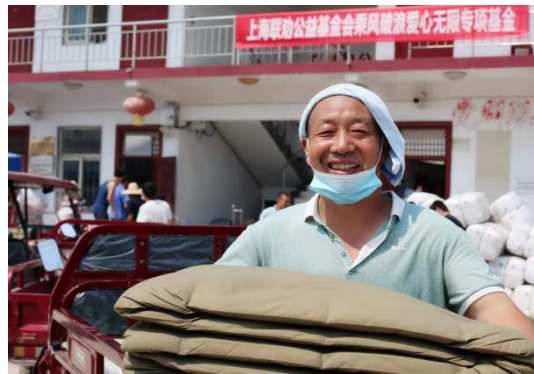
图 19：受灾群众领取应急物资

在救灾过程中，一山一水充分发挥了社会组织点多面广、专业性强的特点，在社区动员、信息宣传、志愿服务等多方面为受灾群众提供专业服务，为当地受灾群众送去物资的同时也为他们积极面对灾后重建工作树立了信心和希望。