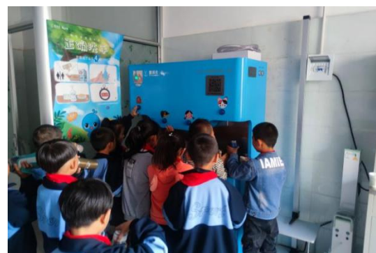
图 32：净水设备使用照片

一山一水作为壹基金净水计划项目甘肃省督导机构。推荐酒泉市、庆阳市、临夏州3个市州的3家社会组织合作，为3个区县的34所农村学校提供总价值1,578,500元的纳滤校园净水机41台，并为每所项目学校的每个学生配套专用儿童健康水杯，结合发放的设备开展校园安全饮水卫生教育活动，超过3.6万儿童从项目中受益，改善了饮水质量，提升了饮水安全意识。