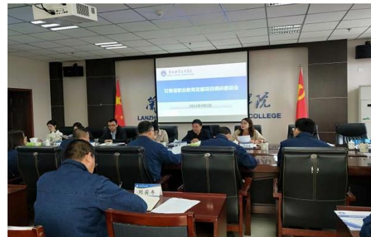
图 11：职教学校调研座谈会

2021 年，一山一水受甘肃省世行项目职业教育项目办委托，先后实施了“世界银行贷款甘肃省职业教育发展项目甘肃省职业教育师资培训效果评价研究”、“世界银行贷款甘肃省职业教育发展项目甘肃省职业院校校长专业能力建设研究”，研究报告正在修改完善阶段；以及“中国甘肃职业技术教育体系研究—人力资源开发评估（SABER）”、“培训评估项目（TAP）”，研究成果已提交，且得到了委托方的赞扬和认可。职业教育课题研究成果为甘肃省职业教育发展提供了理论参考和政策建议。