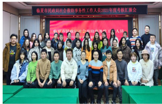
图 17：临夏市协理员年度考核汇报

在项目周期内，一山一水为三市、区（县）民政协理员提供督导培训和年度综合测评，不断提升协理员综合能力的同时，全面了解了协理员的工作情况和需求。政府购买服务项目通过第三方力量壮大了民政人才队伍，有效缓解了基层社会救助经办服务能力薄弱和压力大的问题，有效落实了中央、省、市关于推行政府购买服务，全面加强基层社会救助经办服务能力的通知精神，充分发挥了市场机制，以岗位购买的形式，为困难群众提供及时、高效、专业的救助服务，提高