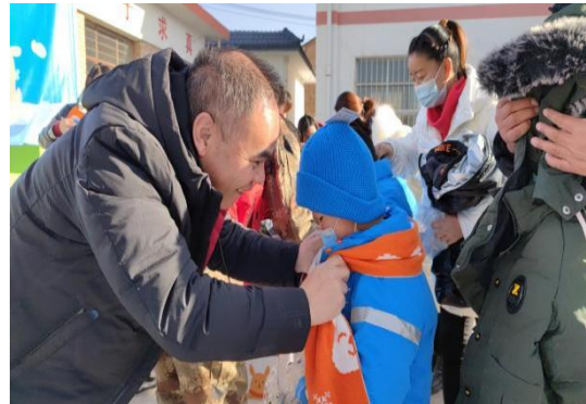
图 31：2021 年温暖包项目启动仪式

2021年，在一山一水的协调下，省内19家公益机构通过联合筹款方式为甘肃省困境儿童发放壹基金温暖包1913个，覆盖甘肃省9个市（州）、青海省1地市，动员上千人次志愿者，缓解困境儿童过冬困难问题，使儿童度过一个温暖的冬天。