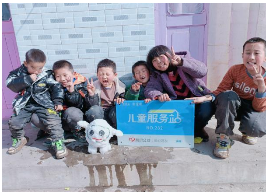
图 23: 受益儿童活动照片

项目执行期间，一山一水组织了 1 期能力建设培训，根据项目要求和疫情防控要求，同时开展线上、线下儿童服务活动，对白银市、张掖市、酒泉市、兰州市、天水市、临夏州等地的 25 个儿童服务站点进行了实地督导，通过对站点布置、站点卫生、站点安全等进行查看，与受益相关人员进行访谈，了解了站点的运行情况及面临的问题，并及时回应了各社会组织提出的问题，给出了解决问题的方法和建议，确保各地儿童服务站安全有序的运行。截止 2021 年 11 月，壹基金儿童服务站项目为甘肃省 145,734 人次的儿童提供了服务，开展服务时长为 41,035.98 小时，有 5596 人次志愿者参与了站点活动开展。发布项目进展公众号 1102 篇。