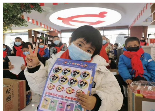
图 34：公众科普宣教活动

“不要烫伤我的童年”项目是中国社会福利基金会烧烫伤关爱公益基金于 2016 年发起的公益项目，旨在通过开展“远离烫烫小怪兽儿童课堂”、“远离烫烫小怪兽儿童友好安全体验空间”等多种形式的预防烧烫伤公益活动，让孩子和家长学会烧烫伤预防和急救知识，让孩子从小学会保护自己，拥有一个健康、快乐的童年。