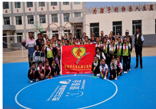
图 33：运动场活动照片

2021 年，一山一水协助金昌伙伴机构申请壹基金壹乐园运动汇项目，为 5 所农村小学铺设总价值 600,000 元的多功能运动场，受益儿童 2388 人。