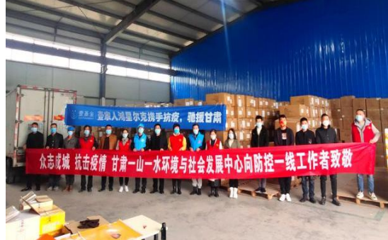
图3：筑牢疫情防控“红色堡垒”主题党日活动

10月30日，一山一水携手深圳壹基金公益基金会，为甘肃省募集到价值309万元的棉衣和羽绒服，一山一水党支部结合党史学习教育“我为群众办实事”的要求，在甘肃省社科联机关党委支持和指导下，积极响应省民政厅社会组织管理局《关于动员和规范全省社会组织有序参与疫情防控的倡议书》的具体要求，创新开展“筑牢疫情防控‘红色堡垒’”主题党日，联合省内12市州83家社会组织为奋战在疫情防控第一线的3744名抗疫志愿者和6256名社区困难群众发放“爱心棉衣”，致敬抗疫一线志愿者，帮扶疫情期间封控的困难群体，以实际行动助力疫情防控，凝聚了众志成城、同心“战疫”的磅礴力量。