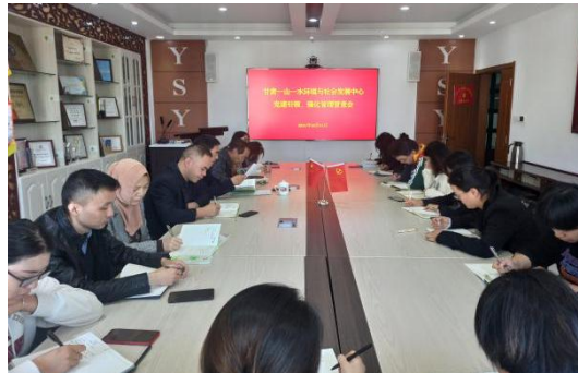
图7：党建引领、强化管理督查会

10月11日，一山一水党支部组织全体党员和员工在机构会议室召开“党建引领、强化管理督查会”，对前三季度工作进行了全面督查调度，强调党建引领机构各项工作，强化机构管理制度与措施，加强机构思想政治建设工作，全体党员和员工从思想上加强自我管理、端正工作态度、激发工作积极性、提高工作执行力。