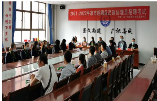
图 16：崆峒民政协理员招聘考试

2020 年至 2021 年，一山一水经过资格审查、报名、考试、面试、体检、公示、签订合同等环节，严格按照公务员录用标准遴选出优秀人才担任民政协理员，为东乡族自治县民政局、平凉市崆峒区民政局、临夏市民政局招聘 142 名民政协理员。