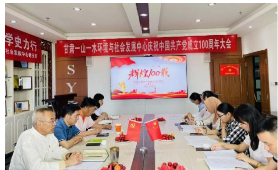
图2：七一主题党日活动

7月1日，为庆祝中国共产党成立100周年，一山一水党支部组织全体员工在机构会议室进行“学史明理 学史增信 学史崇德 学史力行”七一主题党日活动，通过深入学习习近平总书记“七一”重要讲话和在党史学习教育动员大会上的重要讲话，继续保持良好精神状态，在学史明理、学史增信、学史崇德、学史力行中学思践悟、扬长避短、砥砺前行，进一步增强“四个意识”、坚定“四个自信”、做到“两个维护”。