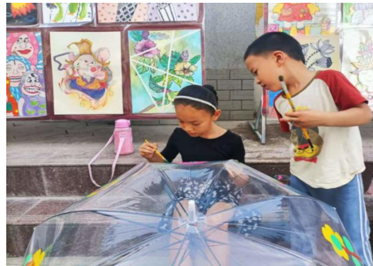
图 24: 受益儿童活动照片