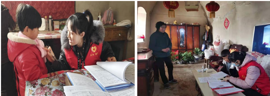
图 27-图 28：受益人建档评估项目活动

“一个鸡蛋的暴走”项目旨在通过开展快乐且自主的徒步筹款，以资助公益项目的形式帮助困境儿童减轻和摆脱困境，保障困境儿童的基本权利，让困境儿童健康快乐成长、平等发展，创设儿童友好型社会。