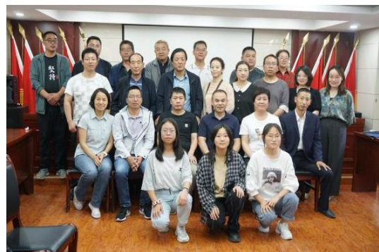
图 25：联合劝募公益沙龙

2021 年，一山一水作为好公益平台甘肃枢纽机构，推介好公益平台品牌项目、辅导伙伴机构完善内部管理、推动伙伴机构多元化筹款，实地走访甘肃省白银市、庆阳市、平凉市等 33 家市县级伙伴机构，并为 43 家伙伴机构做一对一辅导。截止