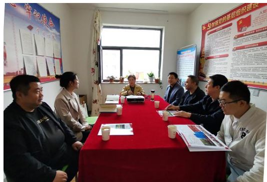
图 5：县域公益组织督导调研

9 月 26 日-30 日，为助推乡村振兴，做到为基层群众办实事、办好事，结合省社科联“为党旗添光彩，为群众办实事”具体要求，一山一水联合省社科联学会管理部组成调研团队对平凉市、庆阳市实施的助力乡村振兴、妇女发展、儿童培育的项目进行了调研督导。本次调研通过实地走访、召开座谈会等方式了解了省内县域社会组织的机构运行现状和项目实施情况，并结合“一个鸡蛋”项目，围绕公益活动助推乡村振兴进行了专题辅导。