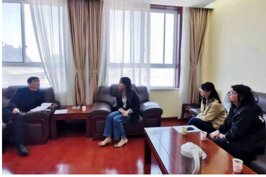
图 14：救助管理站工作对接