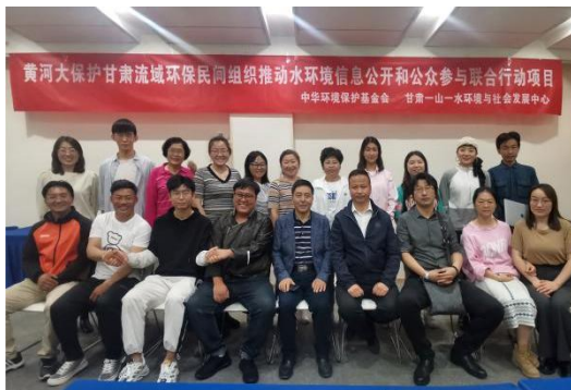
图 21：第一期能力建设培训

2021年，一山一水联合省内20家环保社会组织开展了黄河流域社会组织推动水环境信息公开和公众参与能力建设、黄河流域水环境保护信息公开线下宣传活动、面对公众开放的水环境保护单位或设施参观活动共计4场，组织环保社会组织代表、兰州市热心环保事业的企业、高校、媒体单位和市民志愿者70余人参加活动，向公众宣传黄河流域水环境保护信息公开渠道以及公众参与的方式并发放宣传折页。通过网站、微信公众平台、今日头条等线上渠道，对项目活动进行了宣传推广，让更多的社会公众了解黄河流域水环境保护法律政策和活动，实现水环境保护信息公开，提升公众参与黄河流域水环境保护的意识。