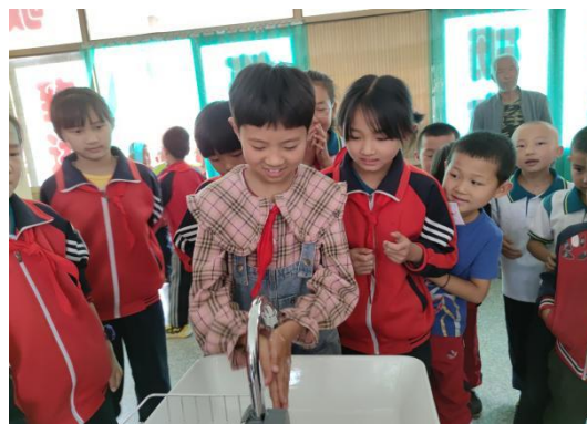
图 30：洗手台使用照片

壹基金洗手计划项目旨在为乡村儿童提供洗手卫生设施和卫生知识教育，从而改善农村儿童洗手状况，缓解因卫生原因引发的疾病。一山一水作为洗手计划项目全国枢纽机构，在壹基金支持下为参与项目机构提供服务，改善农村儿童洗手卫生习惯，用心“手”护他们的未来。